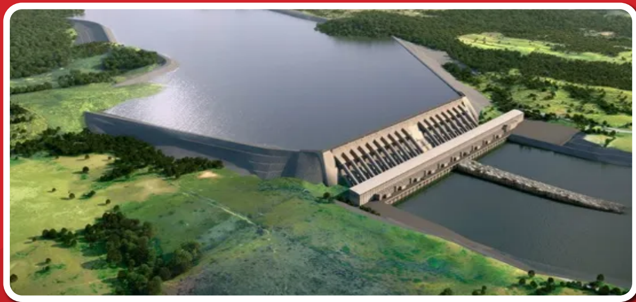
UHE Belo Monte